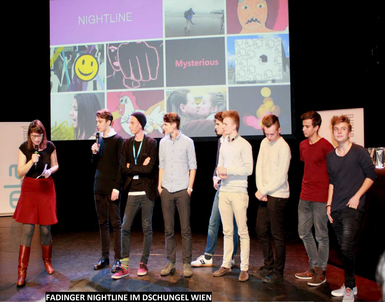
FADINGER NIGHTLINE IM DSCHUNDEL WIEN